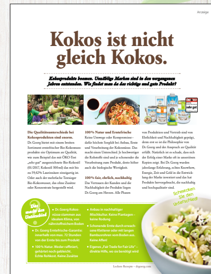
Beispiel für Advertorials