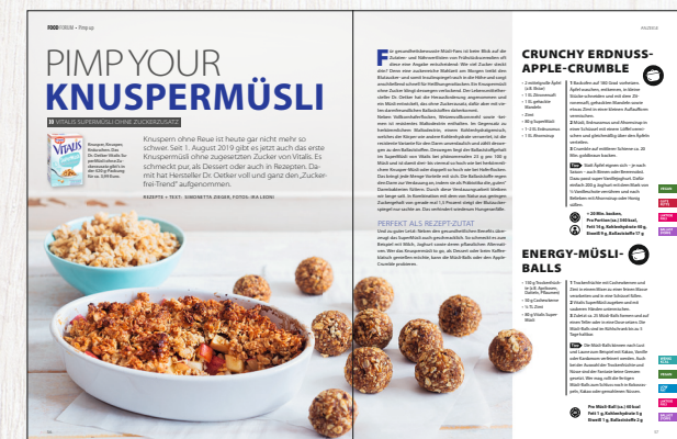
Beispiel für Pimp-Up